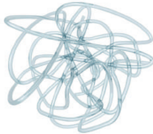
Acido ialuronico non reticolato